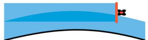
senza BoomPilot without BoomPilot