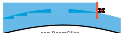
con BoomPilot with BoomPilot

BoomPilot è l'ideale complemento ad ogni sistema GPS con barra di guida.